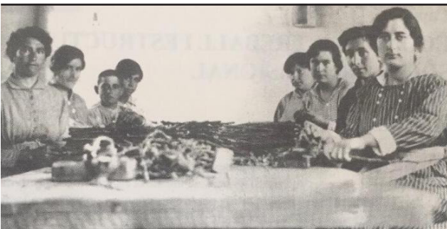
1 Avinguda Catalunya, 13-15

Dones treballant en activitats agrícoles.