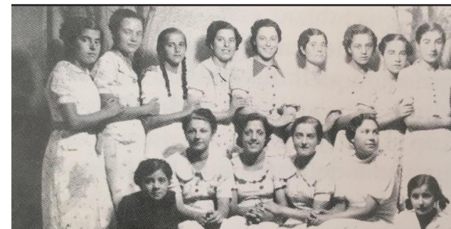
4 Parc de la Memòria, camí del Fondo, s/n