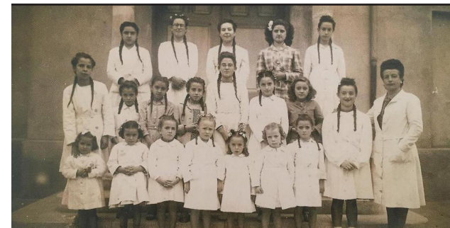
3 Avinguda del Penedès, s/n (Edifici de la Llar d'Infants de la Ràpita)

Aquest recorregut el podeu realitzar de forma lliure el dia i hora que us vagi bé. A més d'aquest desplegable, trobareu un codi QR a cada punt en el que podreu escoltar l'explicació ampliada.